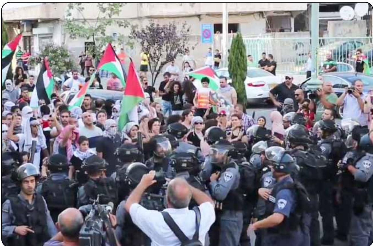
تظاهرة مناصرة لغزة في الناصرة.

وختمت الصحفية: "إن هذا التحريض الذي يتدرج من داخل حكومة إسرائيل إلى المجتمع هو الذي يؤدي في نهاية المطاف إلى العنف الجسدي الذي ينتشر في التظاهرات في هذه الأيام حيث يهاجم نشطاء اليمين المتطرفين الذين يحتجون على سياسة الحكومة وهم يهتفون "الموت للعرب" و"الموت لليساريين".