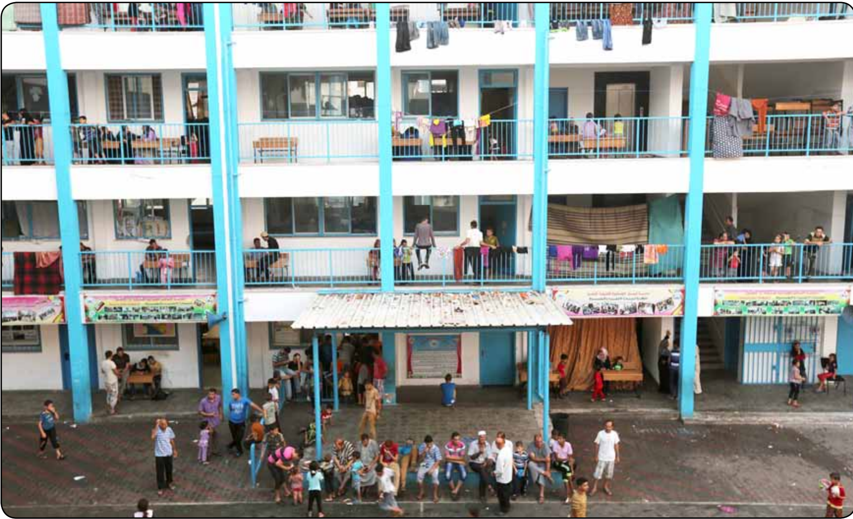
مشهد لمدرسة أونروا وسط غزة مكنظة باللاجئين، وكان استهداف جيش الاحتلال الإسرائيلي المدارس آثار انتقادات دولية حادة.