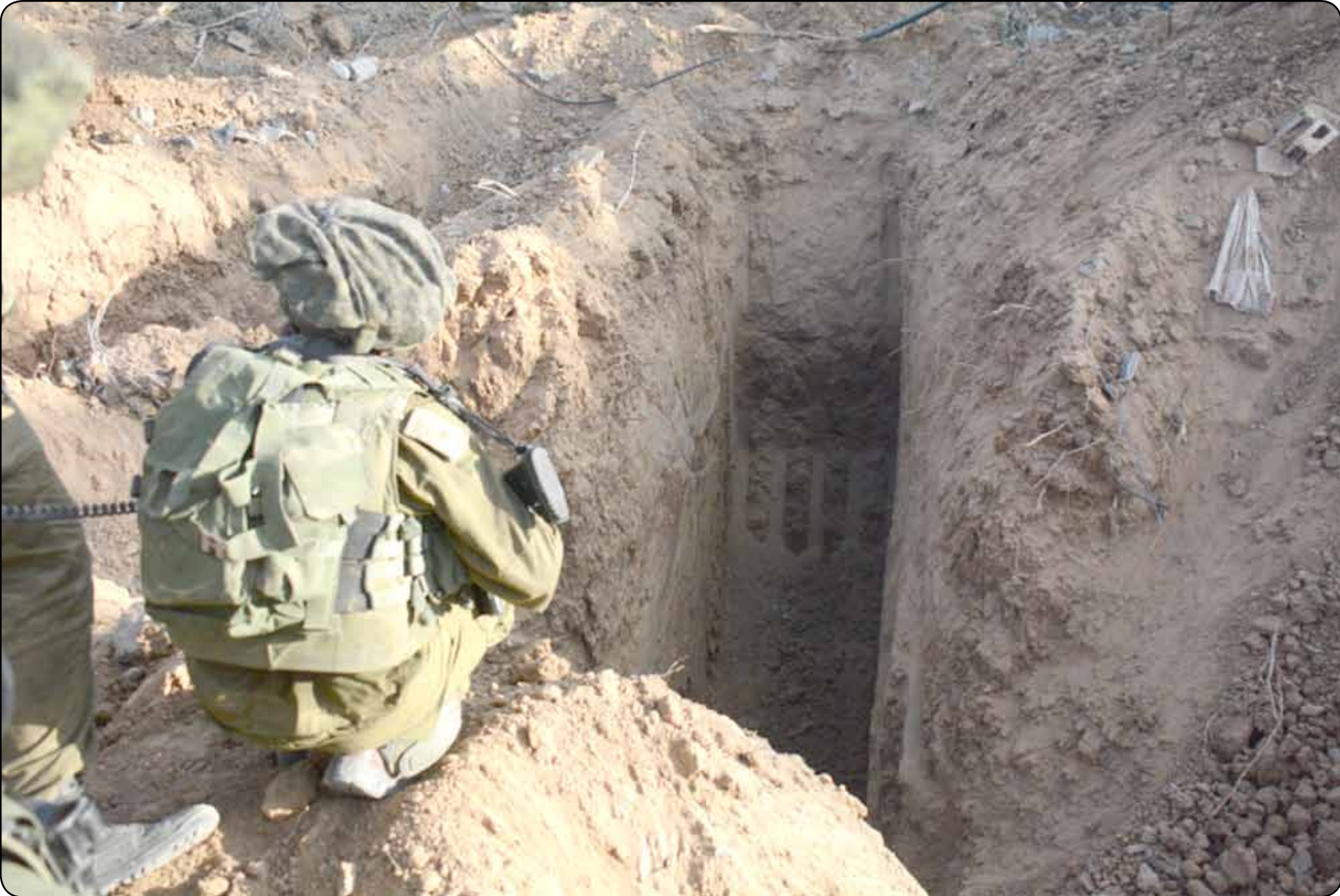
جندي إسرائيلي امام فتحة أحد الأنفاق التي حفرتها المقاومة في غزة

ورئيس الشاباك، يورام كوهين، المتحصن في عزبته، يخضع بشكل مباشر لبنيامين نتنياهو. وكلاهما، كوهين ونتنياهو، مسؤولان عن فشل الشاباك في غزة».