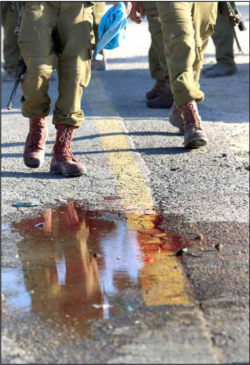
جنود إسرائيليون على مشارف غزة.

*يبدو أنه لا سبيل إلى إلغاء أو دره التهديدات المحدقة بإسرائيل ولا بد بالتالي من معرفة كيفية التعايش معها من خلال إدارة شاملة وسليمة قدر الممكن تحول دون إخراجها إلى حيز التجسيد العملي*