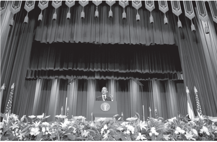
خطاب أوباما التاريخي في جامعة القاهرة في العام ٢٠٠٩.

وفي المحصلة العامة، كانت إقامة إسرائيل فكرة يُنظر إليها عموماً، في ذلك الوقت، على أنها نتيجة حتمية لحرب خاضها اليهود، كما كان يُنظر إليها قبل أي شيء آخر على أنها ملاذ للناجين من المحرقة ولأسرى معسكرات الاعتقال النازية. أما مسألة إعادة توطين مئات آلاف اللاجئين الفلسطينيين ضحايا النكبة، فقد نظر إليها أساساً باعتبارها مهمة إنسانية، وليس استراتيجية سياسية. وكان من المفترض، بموجب تلك النظرة، أن تتحمل إسرائيل المسؤولية عن مستقبلهم مادياً (فيزيائياً) ومالياً فقط في حال إحلال السلام مع العرب.