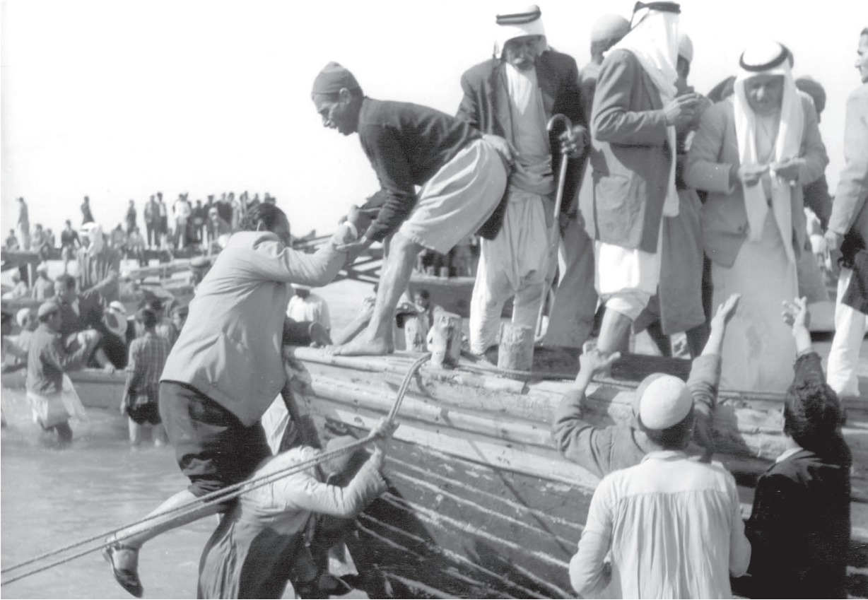
النكبة: فعل ماضٍ مستمر.

أمل. وتَحْمَلُ عذاب المنفى شيء مبرّر. والتصوّر للمنزل والحقل والجمال المنشود والسعادة القصية وغيرها أمر مشروع. أما التجربة الأخرى، اللجوء في الوطن، فإنها أمر غير مبرّر وصعب الاستيعاب في حدود وعي الطفل والصبّي. إنك تشعر بالغصة والقهر حتى في أجمل أحلامك. وتكتسب ملامح انعكاسات واقع، هي أقرب ما تكون إلى الرموز.