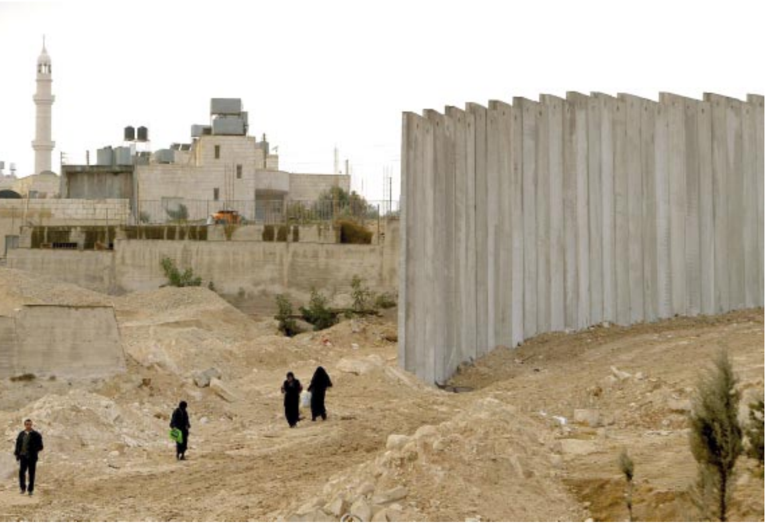
سوقير عن جدار الفصل العنصري: خارطتي هي الأساس