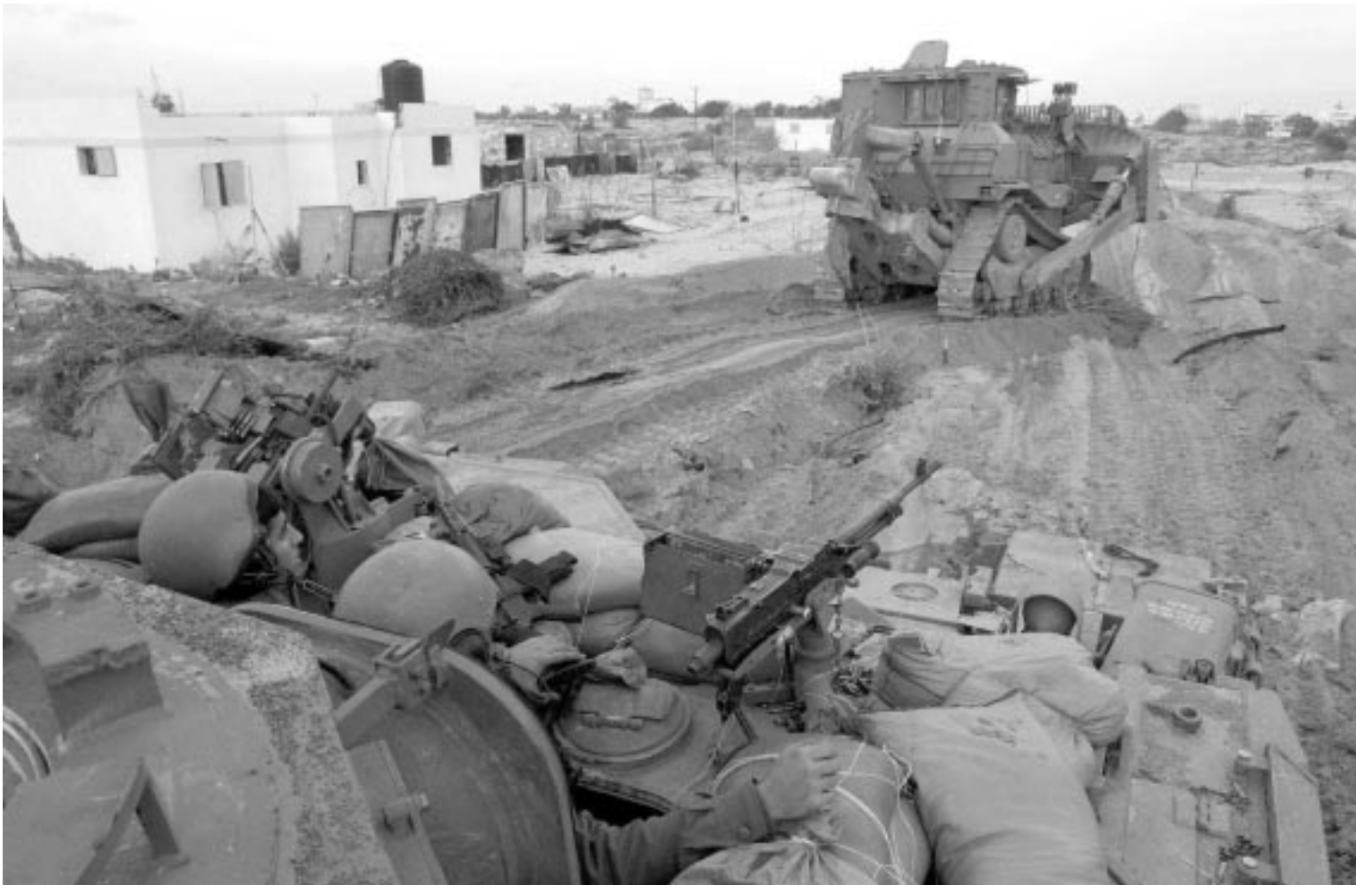
الانفصال عن غزة: دوافع ديمغرافية