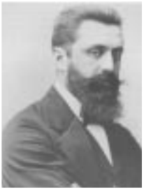
بنيامين زئيف هرتسل مؤسس الحركة الصهيونية

وقد حصلت الوكالة اليهودية على دعم وتأييد كبيرين من البريطانيين عندما تبني هؤلاء في نطاق خطة «لجنة بيل» فكرة الترانسفير حتى لو تم بالقوة، بغية تطبيق الحل الذي بدا لهم في ذلك الوقت الحل الأفضل، وهو تقسيم البلاد. فمنذ ذلك العام، (١٩٣٧) كان واضحاً أن التيار المركزي في الحركة الصهيونية، تيار حركة «العمل» يسعى لتنفيذ عملية ترانسفير تشمل جميع السكان الفلسطينيين المتواجدين داخل حدود الدولة اليهودية العتيدة (في العام ١٩٣٧ كان هناك حوالي ربع مليون فلسطيني من المفروض ان يكونوا ضمن سكان دولة يهودية مستقبلية في حال تم قبول خطة «بيل» البريطانية) وقد كتب دافيد بن غوريون لنجله «عاموس» عقب تقرير «لجنة بيل»، بأنه ستكون «ثمة ضرورة لطرْد العرب في سبيل الحصول على استقلال يهودي في أرض اسرائيل».