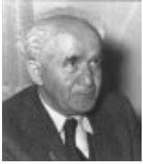
دافيد بن غوريون

وبسبب الشعور بنجاح عملية الطرد فقد استمرت هذه العملية حتى بعدما انتهت حرب العام ١٩٤٨.. لقد استمرت عملية «الترانسفير» هذه حتى العام ١٩٥٤. كانت هناك استمرارية ليس فقط في الأعمال ذاتها بل وفي مركزية الأشخاص الذين مارسوا عملية الطرد أثناء الحرب، فبعد العام ١٩٤٨ واصلت جهتان رئيسيتان متابغة ورعاية عملية الطرد، وذلك تحت امرة وزعامة رئيس الحكومة دافيد بن غوريون. الجهة الأولى تمثلت في رجالات وناشطي الاستيطان سواء العاملين في اطار مؤسسة «الكيرن كيمت» او في الوكالة اليهودية، والذين واصلوا بايعاز وقيادة يوسف فايتس، البحث عن اراضٍ خصبة أو جيدة، وعن قرى في المناطق التي اعتبرت حيوية، ليطم الحاقها بقائمة الأراضي والقرى المقرر طرده اصحابها.