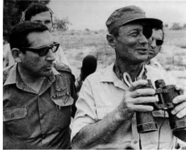
موشيه ديان ورجعهم زينيبي العام ٧٧

وكانت حكومات «العمل» المتعاقبة، لغاية الاطاحة بها في (انقلاب) العام ١٩٧٧، قد املت في حل «المشكلة الديمغرافية» عن طريق ضم جزء من مناطق الضفة الغربية الى الاردن، وقد عكس هذا التوجه خطة يغانال لون (احد زعماء الحزب) التي تم تبنيها بصورة غير رسمية كسياسة للحكومة حتى العام ١٩٧٧، هذه الخطة كانت بمثابة مشروع تقسيم آخر، لكن في هذه المرة دار الحديث عن تقسيم ٢٢٪ من مساحة فلسطين، لم تكن تخضع بعد للسيادة الاسرائيلية، بل تخضع فقط للاحتلال الاسرائيلي، هذا التقسيم كان من المفروض ان يؤدي ايضا الى تقسيم السكان في المناطق المحتلة، ففي الأماكن التي ترغب اسرائيل بضمها، او تقوم ببناء مستوطنات فيها لحساب «غوش ايمونيم» او غيرها من الجماعات الاستيطانية، لا يمكن، حسب خطة التقسيم هذه، السماح بوجود او بقاء فلسطينيين. وكانت هذه الفترة، ١٩٦٧ - ١٩٧٧، شهدت استمراراً في المحاولات الثقافية والفكرية التي تنكر وجود الشعب الفلسطيني، وفي هذه المرة لم تكن الحجة ان الفلسطينيين في المناطق المحتلة هم جزء من الشعب العربي، وانما كانت الحجة انهم (اي الفلسطينيين) جزء لا يتجزأ من الشعب الاردني، وهكذا تم طرد السكان