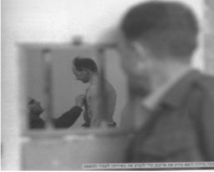
أدولف أيخمان قبل إعدامه.

برنامج وضعه متحف لוחامي هغيتاؤوت (محاربو الغيتوات) ويهدف الى تعليم أولاد العالم حول الكارثة. توجد في الموقع معلومات حول هذا البرنامج، مواضيع تعليمية، وظائف قدمها طلاب، وتقديم ورشات عمل للطلاب والمعلمين.