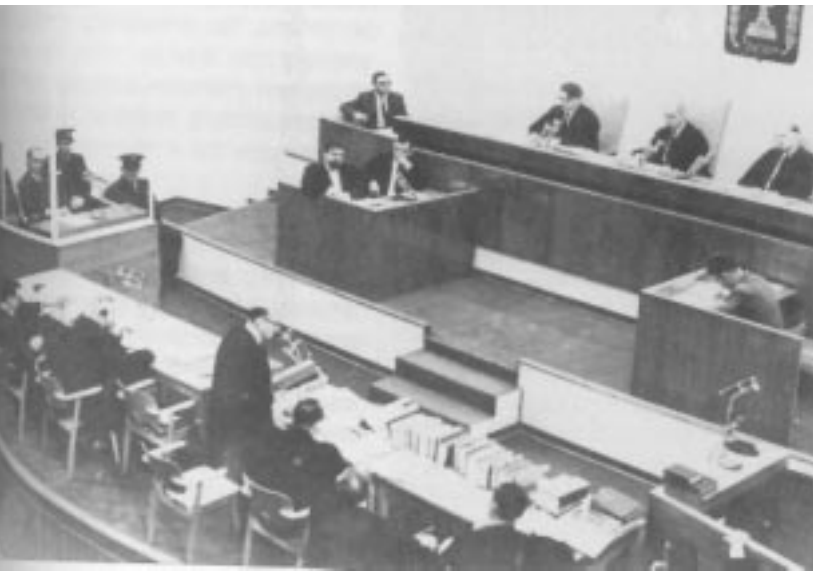
محكمة أدولف ايخمان في القدس ١٩٦١.

شباب يهود من اسرائيل ومن الجاليات اليهودية المنتشرة في العالم. وكذلك شخصيات اسرائيلية وعالمية، مثل رئيس دولة اسرائيل ورئيس الوزراء ورئيس أركان الجيش وأعضاء كنيست، وقد ضم في السنين الأخيرة عدد من الطلاب والمعلمين العرب، وعضو كنيست عربي للاشتراك في مثل هذه المسيرات.