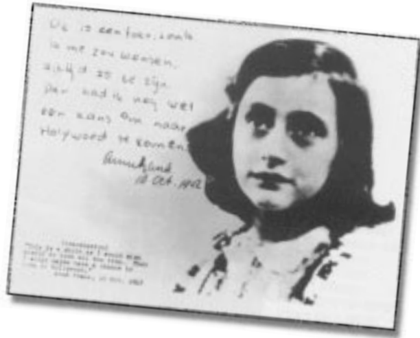
أنا فرانك ... يوميات

إبراز مسألة استمرارية وجود شبح الإبادة الرابض على أبواب إسرائيل واليهود في العالم. ويكفي أن نسوق مثلاً على ذلك، وهو محاكمة دميانيوك (١٤) في إسرائيل، الذي اتهم بأنه هو «إيفان الرهيب»، فقامت مؤسسات صهيونية وإسرائيلية بتجميع مستندات ووثائق تؤكد على أن هذا هو «إيفان الرهيب» الذي نفذ مذابح ضد اليهود. ونقلت جلسات المحاكمة عبر البث الحي والمباشر إلى كل أنحاء العالم. وتقبل عدد من المحامين في المرافعة ضد المتهم وآخرين في الدفاع عنه، والملاحظ أن عدداً من محامي الدفاع قد استقال خلال المرافعات. وكان قرار المحكمة الإسرائيلية بإدانتها بكافة التهم الموجهة ضده. وأكدت إسرائيل أنها لن تتوقف أبداً عن عمليات البحث عن مجرمي حرب نازيين، وأكدت أيضاً أن هذه المحاكمة شاهد آخر على كبر الجريمة التي أصابت اليهود على يد النازيين، وأن من واجب المجتمع الدولي مد يد العون في تحقيق غاية تصفية النازيين من العالم. ولكن، بعد سقوط الاتحاد السوفيتي وانهاره، تم الكشف عن وثائق بينت أن هذا الشخص (دميانيوك) ليس «إيفان الرهيب»، فتمت عملية الإفراج عنه دون إعادة محاكمته وتبرئته من التهم المنسوبة إليه، وقامت السلطات الإسرائيلية بإبعاده عن البلاد، دون ضجة إعلامية، كالتالي واكبت جلسات المحاكمة.