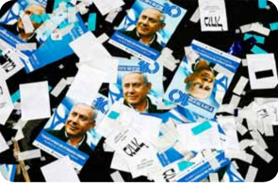
الانتخابات الإسرائيلية: الأوراق، قيد الترتيب.

نحو انتخابات ٢٣ آذار.. الأناظر متجهة إلى القوائم النهائية وإلى واشنطن