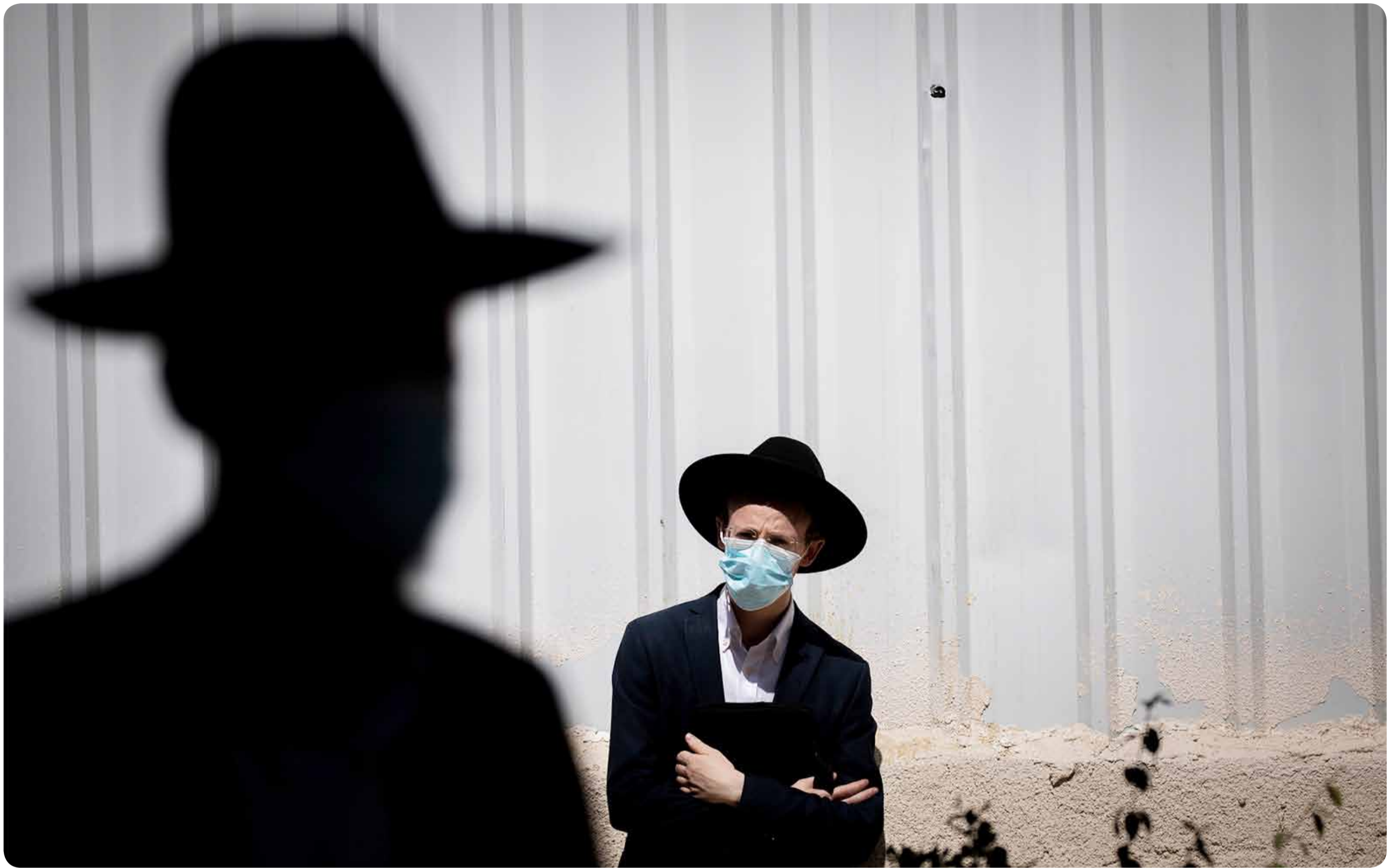
الحريديم وإجراءات كورونا: الابتزاز السياسي يثبث حضوره.