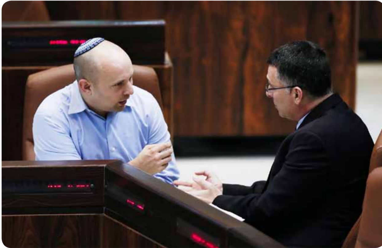
صورة أرشيفية تجمع ساعر وبينيت.

وأمام هذا المشهد، فإن نتانياهو الذي يسعى دائماً لعدم وجود كتل برلمانية كبيرة أمامه، قد يبرز مجدداً أجندته اليمينية الاستيطانية المتطرفة، ولكنه في هذا الملف خيب اضطراراً توقعات المستوطنين، وقطاع اليمين الاستيطاني، بعدم تطبيق مخطط ضم المستوطنات ومناطق شاسعة في الضفة المحتلة، ولم يستغل فترة الرئيس الأميركي دونالد ترامب، رغم أن الأخير ومستشاريه هم من أوقفوا تطبيق الضم، لصالح إبرام اتفاقيات تطبيع مع دول عربية، أهمها لإسرائيل دولة الإمارات، وهي اتفاقيات لم تمنح فترة ليكود ورئيسه