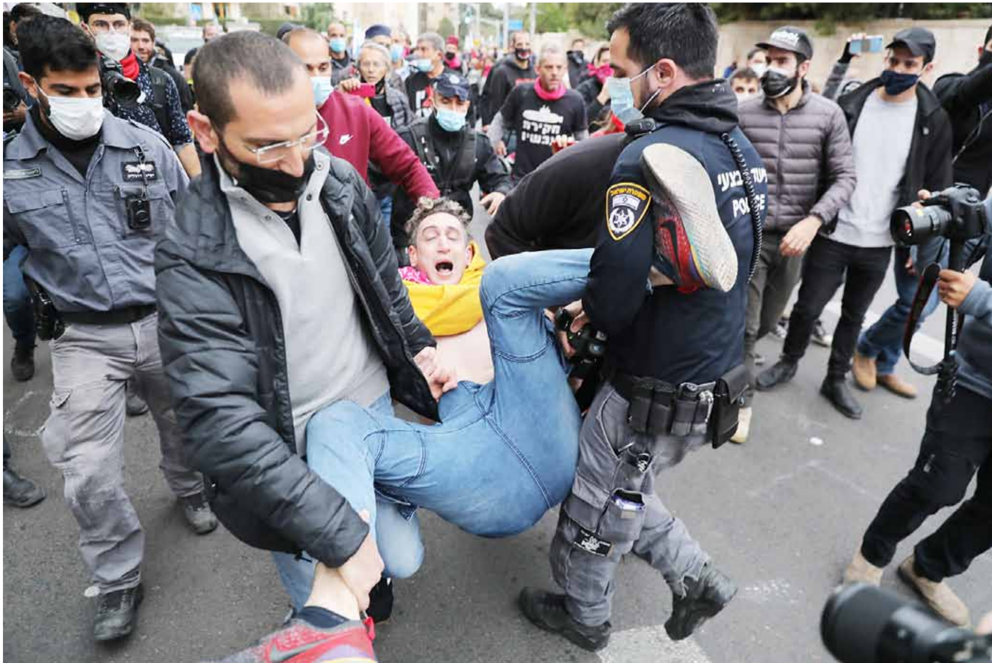
الشرطة تفرض تجمعا قباله مقر إقامة رئيس الحكومة الإسرائيلية بنيامين نتانياهو في القدس يوم ١٣ الجاري.