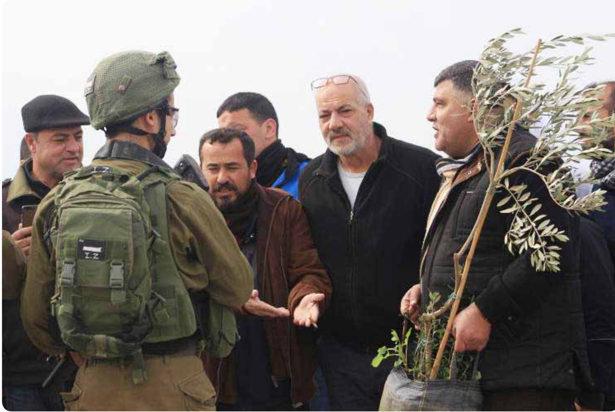
جيش الاحتلال يحول بين أهالي برقة وأراضيهم.