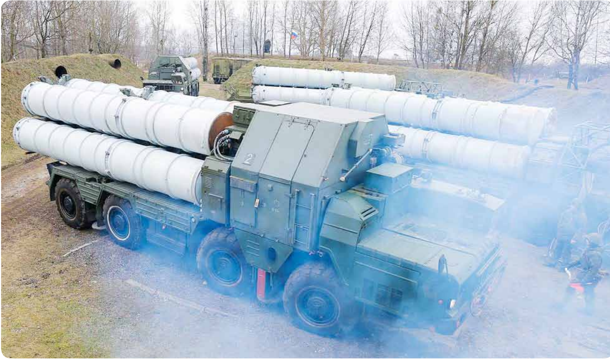
صواريخ إس 300 الروسية الإستراتيجية وجدت طريقها إلى الملعب السوري في «اللعبة المعقدة».

تشهد العلاقات الإسرائيلية- الروسية حالة من المد والجزر تبعاً للظروف الجديدة التي نتجت عن تدخل الأخيرة عسكرياً منذ العام 2010 في سورية في سبيل سعيها لاستعادة مكانتها ودورها التاريخي كقوة عظمى، وكلاعب مهم في منطقة الشرق الأوسط، وهو ما فرض على المستويات السياسية والعسكرية والأمنية الإسرائيلية إيجاد آليات جديدة للتعامل مع «الزائر الجديد» للمنطقة، البسات تضمن لها الاحتفاظ بحرية الاعتداء العسكري على سورية وغيرها كجزء من سعيها المتواصل لامتلاك أدوات القوة في رسم المسار الإقليمي ومواجهة إيران وحلفائها في المنطقة التي ترى فيهم إسرائيل خطراً حقيقياً على «أمنها القومي»؛ هذا التصنيف نرى تجلياته بوضوح في الاعتداءات الإسرائيلية المستمرة والمتصاعدة على الأراضي السورية منذ اندلاع الأزمة فيها العام 2011.