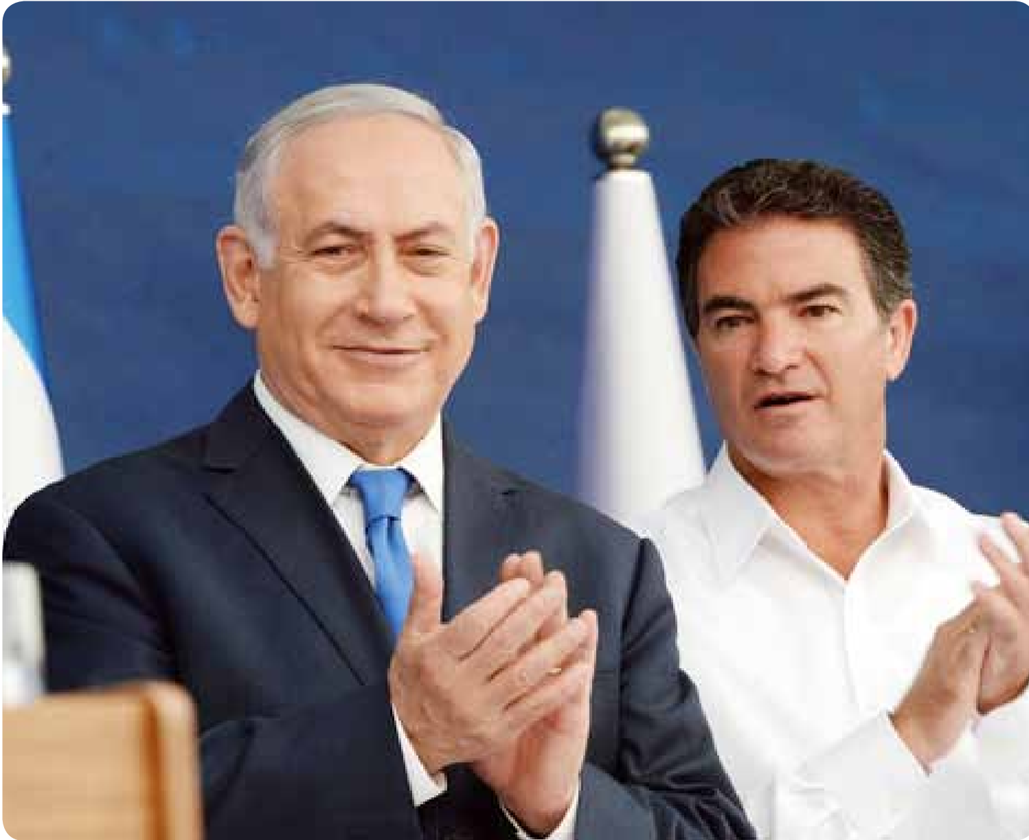
هل يقفز يوسي كوهين قريبا من عربة الأمن إلى عربة السياسة؟

والعلاقات العامة، فهي في المحصلة أدوات لكسب الأنصار ولكسب المعلومات أيضا، لكن هذا الهدف لا يمكن له أن يعلو على الأهداف التي شكل الجهاز من أجلها، فعمليات الاغتيال والقتل خارج نطاق القوانين الوطنية والدولية، وانتهاك سيادة الدول، كلها عمليات جرت أيضا في عهد الرئيس الحالي للجهاز، الرجل الذي يحرص على أنقائه ويوزع الابتسامات في كل مناسبة، ولكنه قطعاً لم يتخل، ولا يمكن توقع أنه سوف يتخل عن توزيع رجاله ونسائه لتنفيذ مهام على غرار العمليات الفظيعة التي راح ضحيتها من الأبرياء المحايدين أكثر بكثير من الأهداف المرصودة.