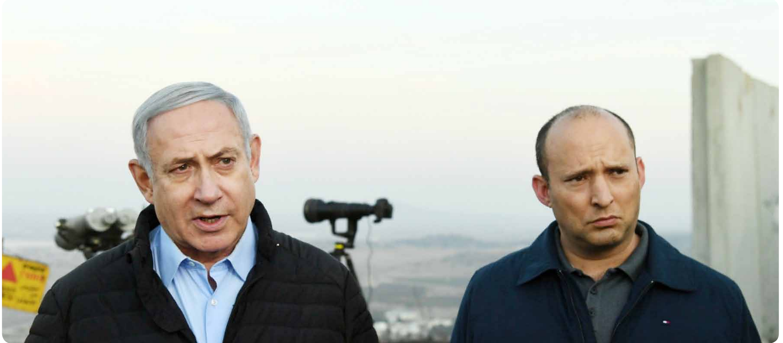
بينيت: قفزات في ظروف صديقة.. وعراقيل.